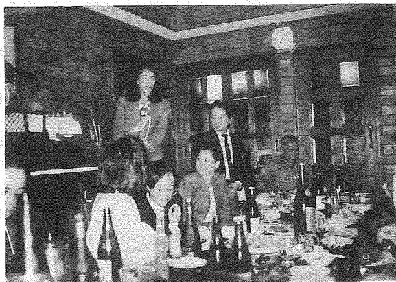
張さん自慢の中華料理を堪能