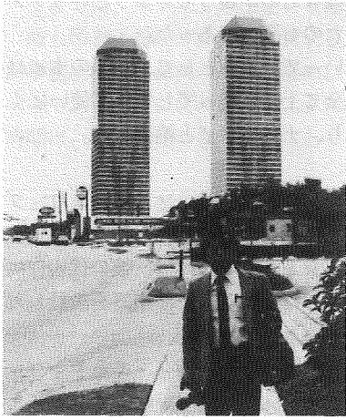
ヒューストン フォーリーフタワー にて筆者